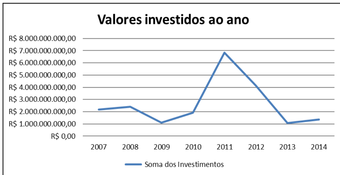
Figura 1 – Gráfico dos valores totais investidos ao ano – PRODEPE