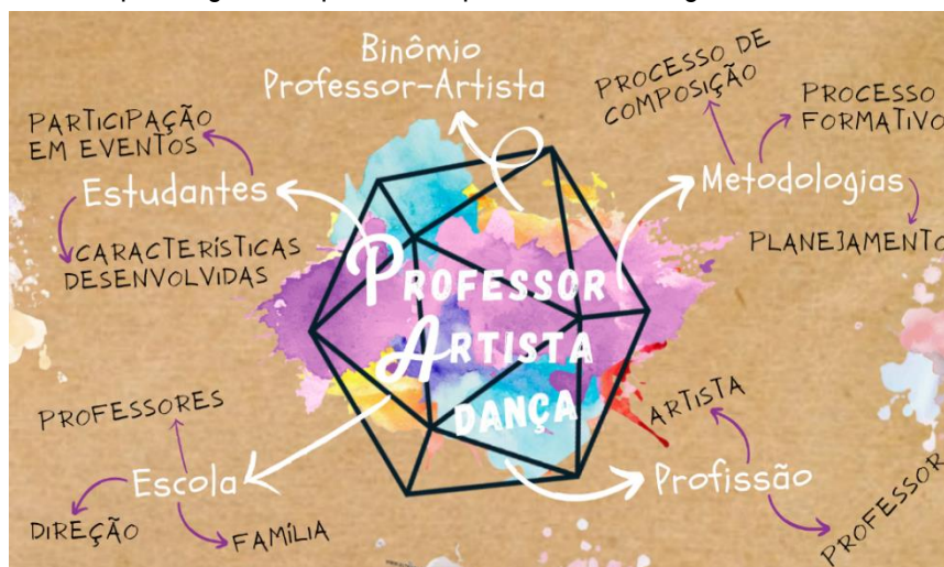
Figura 4: Mapa-mental produzido pela pesquisadora referente às 5 categorias de análise